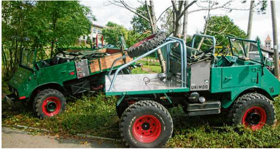
Bereichert wird das musikalische Programm durch das Unimogtreffen, das in diesem Jahr um eine Oldtimerschau unterschiedlichster Fahrzeuge und Modelle erweitert wird.

In der Vergangenheit hat man es beim Musikverein Har-