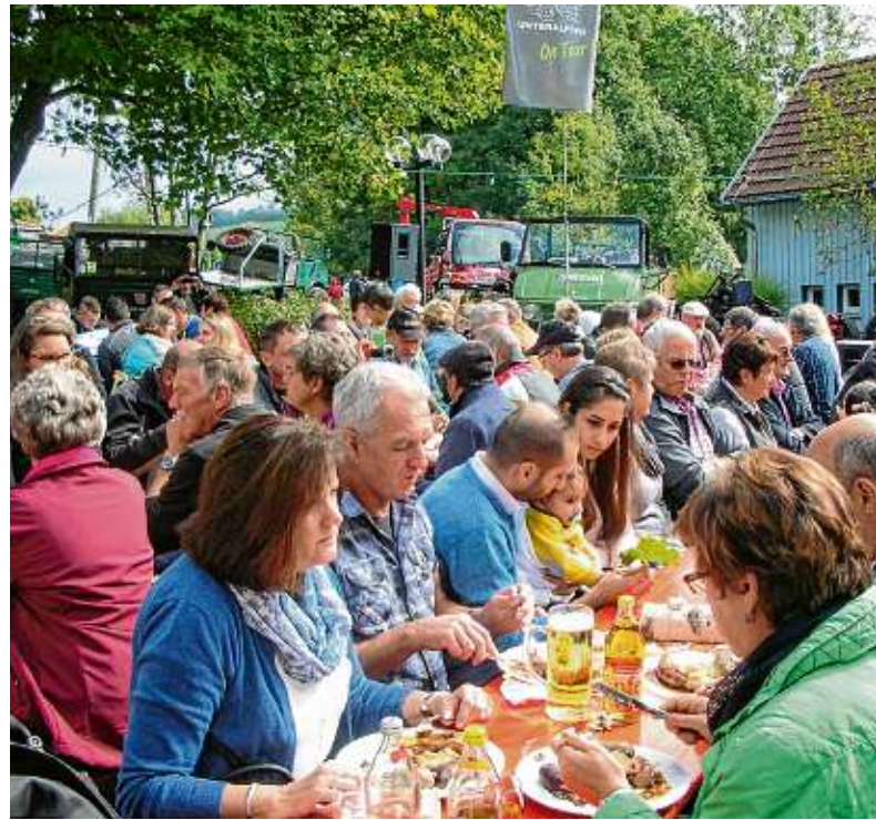
Eingebettet in das Jubiläumsprogramm ist am Sonntag auch das traditionelle Unteralpfer Saufest.