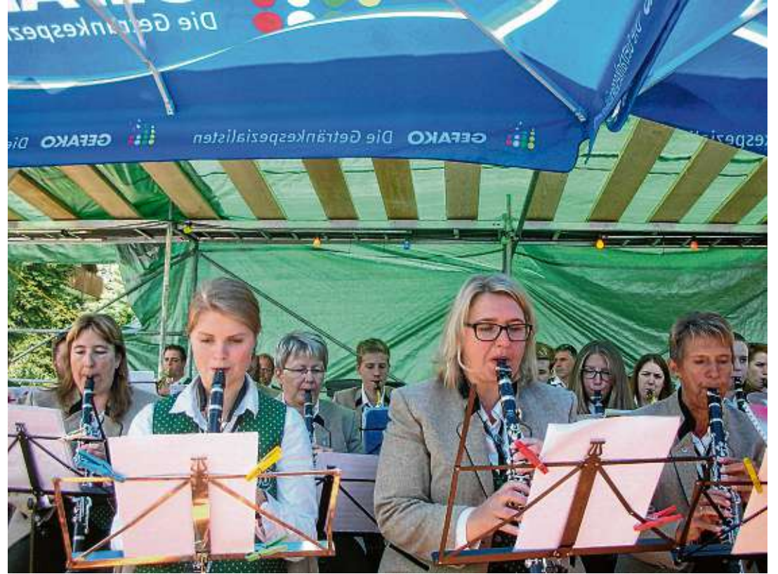
Uniform und Instrumente bleiben am Jubiläumswochenende bei den Unteralpferer Musikern im Schrank. Statt dessen sorgt eine Vielzahl an auswärtigen Vereinen für abwechslungsreiche Unterhaltung.

Krönender Abschluss des dreitägigen Jubiläumsfestes ist am Sonntagabend um 19.30 Uhr der Auftritt der „Feldberger mit Hansy Vogt und Liane“. Ab 19 Uhr ist Einlass für diesen Höhepunkt, dessen Akteure sich stetig größerer Beliebtheit erfreuen und auch in der Region viele Fans haben. Diese haben nun im Unteralpferer Festzelt Gelegenheit die Profimusiker aus nächster Nähe zu erleben.